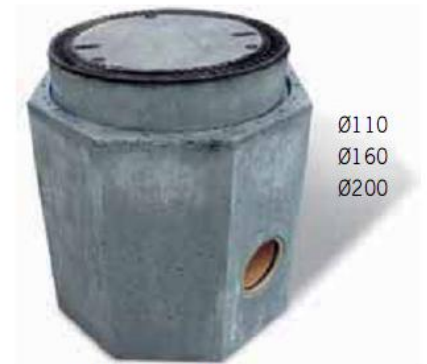
PKG Klasse B125 PVC